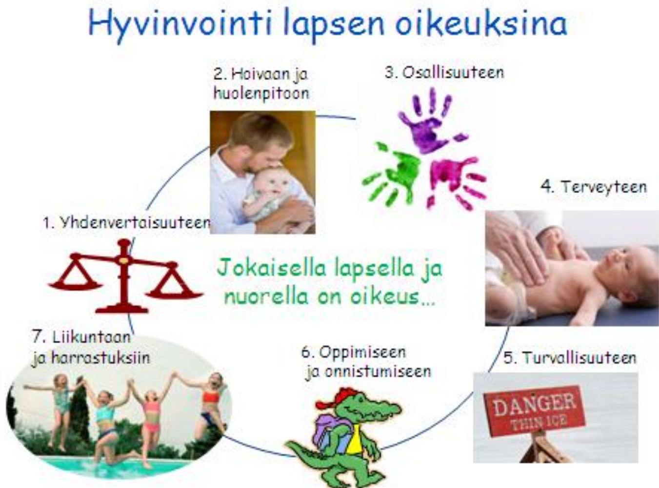
Kuva 1: Lasten ja nuorten hyvinvointiympyrä

Edellä kuvattu hyvinvoinnin määrittely on jäsentänyt suunnitelman valmisteluun liittyvää hyvinvointitiedon keruuta. Lasten ja nuorten hyvinvoinnin toteutumisesta Espoossa on saatavilla jonkin verran määrällistä tietoa, mutta laadullinen tieto jää melko niukaksi. Valtaosa nuorten hyvinvointia koskevasta tiedosta on saatu joka toinen vuosi toteutettavasta Kouluterveyskyselystä. Se on suunnattu yläkoulujen 8. ja 9. luokkalaisille, lukioiden sekä ammatillisten oppilaitosten 1. ja 2. vuoden opiskelijoille. Kouluterveyskyselystä ja sen indikaattoreista löytyy lisätietoa internetistä www.thl.fi/kouluterveyskysely . Palveluja ja niiden käyttöä koskevaa tietoa on koottu asiakastietojärjestelmistä, työntekijöille suunnatusta pienimuotoisesta kyselystä sekä espoolaisille vanhemmille internetissä syksyllä 2012 tehdystä