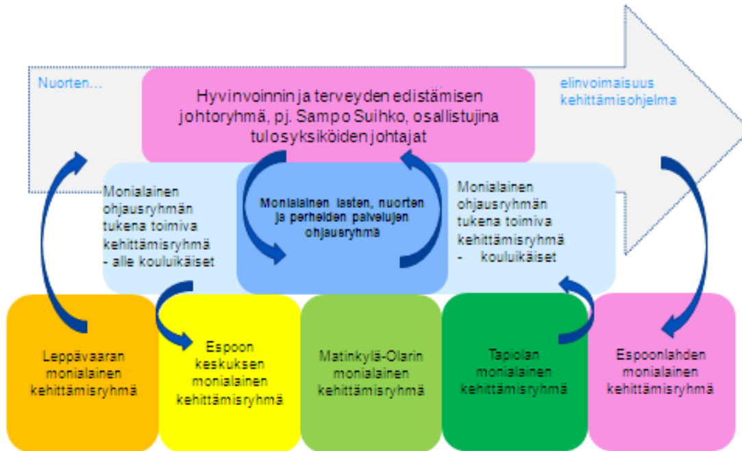
Kuva 3: Yhteen sovittavan johtamisen rakenteet

Kuviossa kuvatut alueelliset kehittämisryhmät perustetaan alueellisia oppilashuoltoryhmiä vahvistamalla siten, että nykyisten alueellisten oppilashuoltoryhmien kokoonpanoa muutetaan vastaamaan uudenlaista tehtävää. Alueilla toimii myös alueellisia hyvinvointityöryhmiä , joiden toiminta ja tehtävät ulottuvat kaikkiin ikäryhmiin. Em. alueellisten ryhmien tehtävät, keskinäinen yhteistyö, päätösvalta ja yhteys linjajohtoon tulee määritellä selkeästi hyvinvoinnin ja terveyden edistämisen johtoryhmässä.