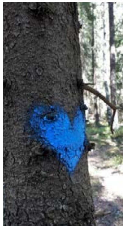
Terveystuontopolun tunnustat näistä sinisistä sydämistä.

Polku on syntynyt paikallisen Olari-seuran aloitteesta ja sitä on edistetty yhdessä Kaupunkiteknikan keskuksen työntekijöiden kanssa. Polun suunnittelun ja rakentamisen on rahoittanut Espoon kaupungin poikkihallinnollinen kehitysohjelma Hyvinvoiva Espoo. Polun ja sen rastitehtävien suunnittelu on toteutettu kolmen työpajan sarjana, joihin osallistui edustajia lähes 20:stä lähialueella toimivasta järjestöstä ja asukasyhdistyksestä. Mukana olivat muun muassa Olarin seurakunta, kaksi paikallista partiolippukuntaa, päiväkotien ja koulujen edustajia, sekä Espoon mielenterveysyhdistys Emy ry. Metsän tarjoamat terveysvaikutukset on näin pyritty huomioimaan rastitehtävien suunnittelussa monin tavoin ja mahdollisimman monta käyttäjäryhmää huomioiden.