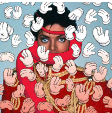
Portrait of Michael Jackson for Interview Magazine by KAWS 09/2009

Näyttely luo katseen rohkeaan ja kehittyvään materiaalien maailmaan. Kuidut, tekniikat, materiaalien tuntu ja monimuotoisuus suuntautuvat taiteeseen ja taidekäsityksen perinteeseen, mutta myös vahvasti teknologiaan ja tulevaisuuteen.